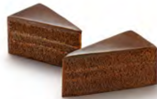
Premium Sachertorte geschnitten