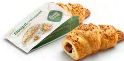
Haubis Nougatcroissant mit Zotter Nougat